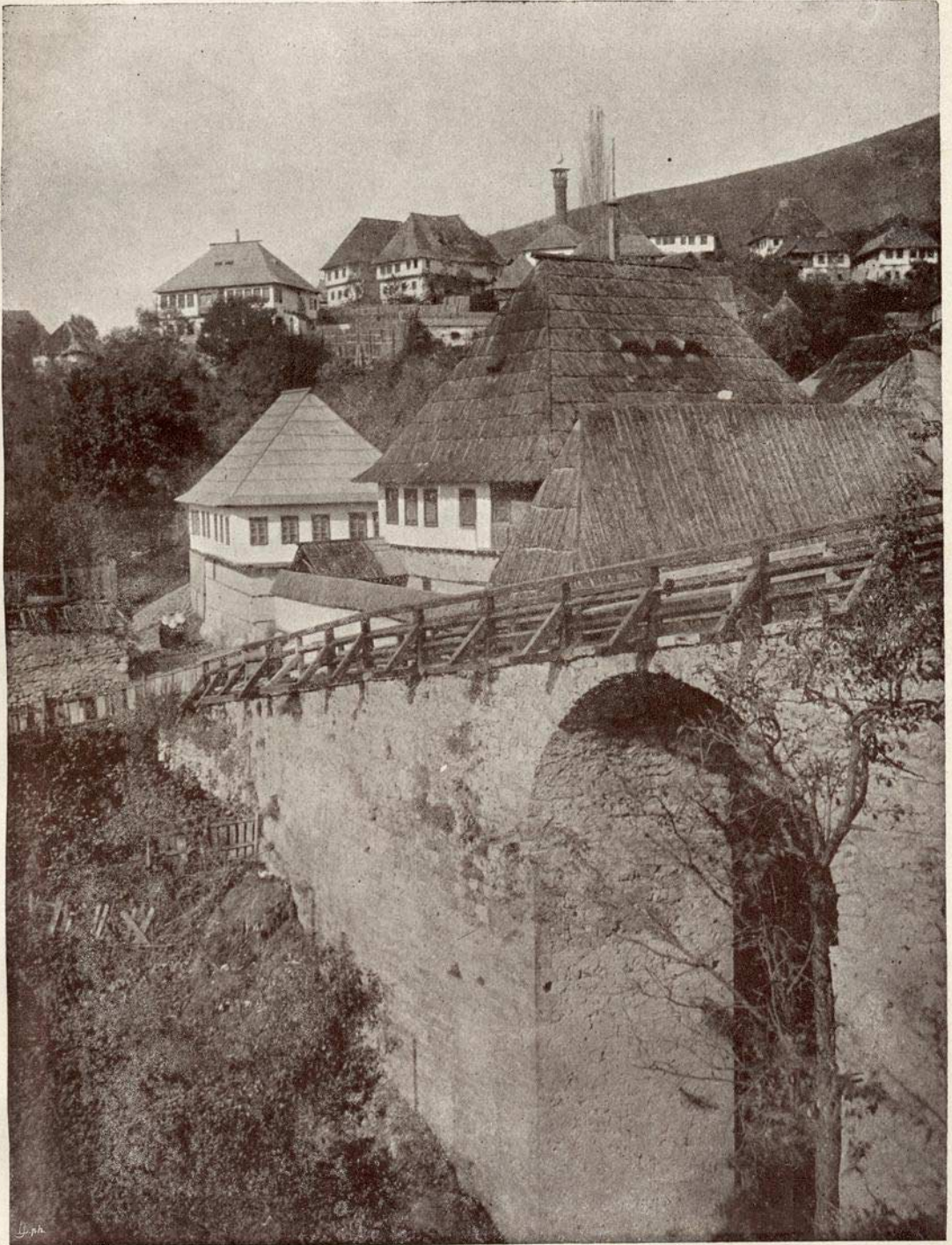
Kraj tvrgjave u Travniku.