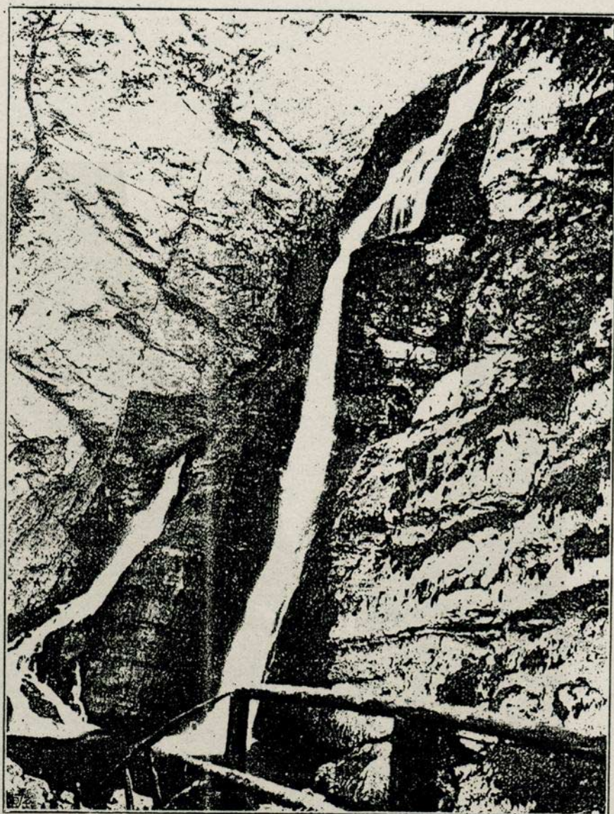
IZVOR SAVICE

venci gotovo sasvim istismnuli sa najljepših i najzgodnijih točaka u Julskim Alpama. Hrvatski se planinari upućuju, da kod uspona na Triglav svakako obidju ovu slovensku kuću, u kojoj će biti bratski primljeni i dobro podvorenii.