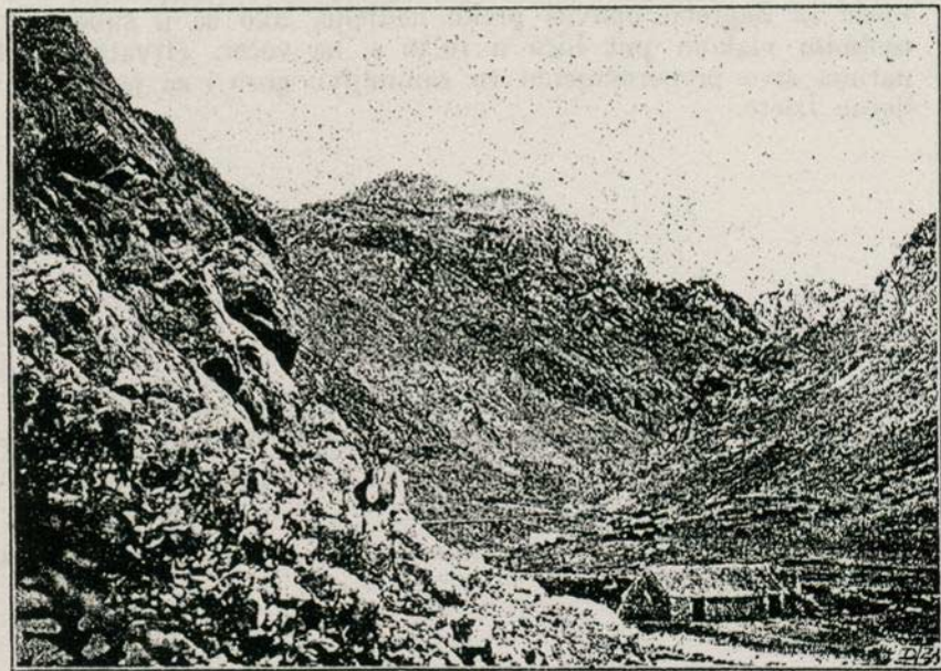
VELIKA PAKLENICA POD VELEBITOM

U slovenskoj planinarskoj kući na Kredarici bilo je na oba blag-danska dana vrlo živahno. Unatoč nepovoljnom vremenu kuću je posjetilo do 100 planinara. Sada je ta planinarska kuća dograđena i može primiti na konak do 60 planinara, a inače je dobro opskrbljena svime, što planinaru srce prosi. Kako ta kuća stoji na najzgodnijem mjestu, tik pod vrhom Triglava, nije čudo, što u nju grnu planinari, pa i sami Nijemci, koji inače prijekim okom gledaju, kako su ih Slo-