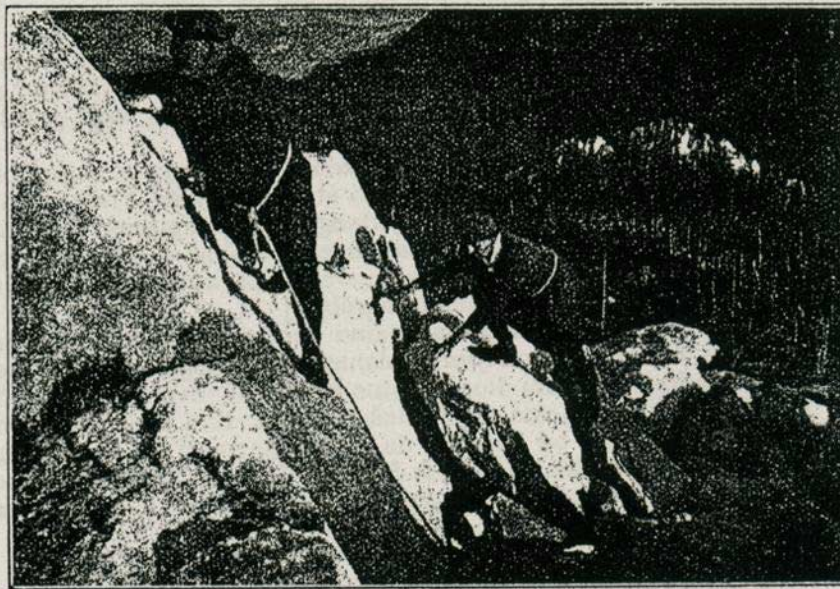
NA VRHU BIJELIH STIJENA

Da paraliziramo tu „otimačinu“, napisasmo na karti posjetnici svoja imena uz kratak opis našega uspona, zatvorismo je u malu bocu i ovu položismo u pukotinu među kamenje. Taj slučaj kao i talijanski napisi na Rišnjaku i Medvedjaku i drugim primorskim gorama neka služe opomenom hrvatskim obrazovanim ljudima, da će nam tudjinci posvojiti naše lijepe planine, ako ih domaći ljudi ne