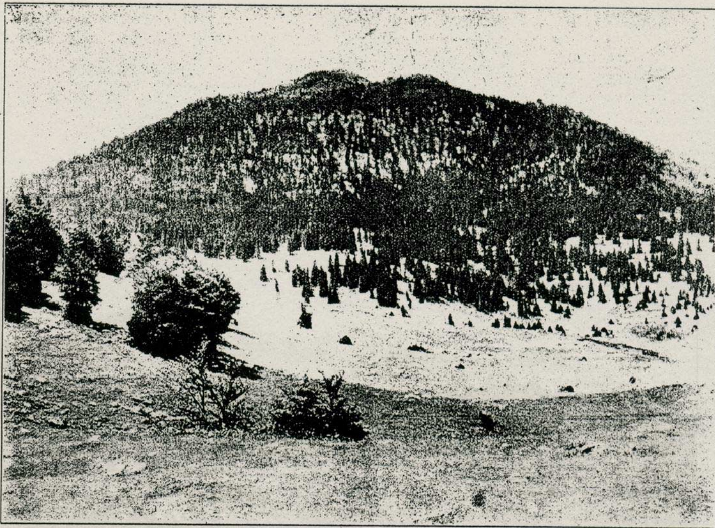
MALI RAJINAC NA VELEBITU

boravka na vrhu bilo teško dijeliti s njime. Pomnivo su pretražili prije odlaska sve humke i obronke odugog plješivičkog vrhunca, ne bi li našli koji runolist, taj ponos i diku svakoga pravog planinara; ali sve njihovo nastojanje bilo je uzaludno. Naprama zapadu spuštaju se gotovo okomito velike gromade izbrušenog i raspucanog gorskog kamenja, na kojem se vide očito tragovi pradavnih ledenjaka. Sa vrha se jasno vidi, da su putovi od Korenice i Bihaća na vrh Plješivice kud i kamo strmiji i naporniji nego li put od Priboja, koji se polagano uspinje i nimalo ne umara planinara. Izlet na Golu Plješivicu od Plitvičkih jezera više je nalik na zabavnu šumsku šetnju, nego na planinarski uspon, a može se izvesti u po dana, ako se u ranu zoru krene na put. Tkogod posjeti naša divna Plitvička jezera, a ima zdrave noge, neka ne propusti uspeti se na Plješivicu, sa koje će se za lijepa vremena naužiti prekrasnog vidika diljem Hrvatske i do mile volje nadisati svježeg i zdravog gorskog zraka. Plitvice i Plješivica međusobno se popunjuju i zajedno tvore skladnu cjelinu savršene prirodne krasote. Tko je obašao samo jedno od od njih, nije vidio potpuno remek djelo čarne prirode. P.