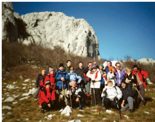
Kamenjakovci pod Kamenjakom

Vrh Kamenjaka, obasjan suncem dočekuje nas u svoj svojoj ljepoti i veličini. Ne zna se odakle je ljepši, s morske ili gorske strane. Stoji pred nama kao pravi domaćin. Dočekuje i ispraća one koji žure na more iz unutrašnjosti ili one koji