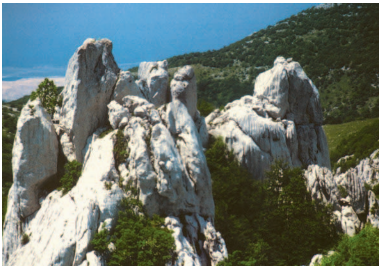
Vranji kuk i Škrbina

Konačno je odlučio doživljaj s vrha Grabara, kamo smo stigli s Alaginca. U visini okna nađemo nove oznake iz suprotnog smjera, znatno veće nego što su bile naše prethodne, a na samom vrhu pola metra dugu, široku crvenu crtu! Tada sam ozbiljno požalio što sam se uopće upustio u označavanje pristupa na taj kuk, ali i počeo razmišljati o tome kako spriječiti pojedince u izražavanju svojih neobuzdanih poriva. Da smo kojom nesrećom uspostavili kakvu novu »transverzalu«,