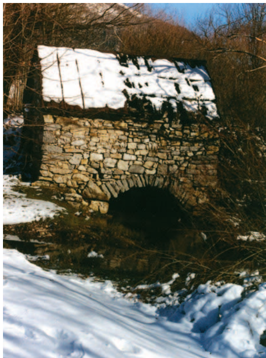
Posljednji od 9 mlinova na potoku Ljubici (Polićev mlin)

Malo nizvodno, kod spajanja pritoka, Ljubica je bila bogatija vodom. Tu je među zadnjima preostala raditi Mićina (Šikić) vodenica. Od tragova ostali su samo temelji i mlinska kola na trulim gredama. U blizini je obelisk iz 1846. godine s izvorom pitke vode i jedan od dva mosta kojim prolazi cesta Gospić-Karlobag. Malo južnije, u