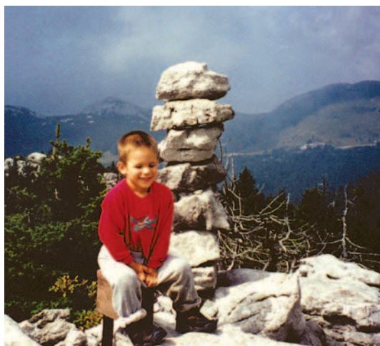
Najmlađi obilaznik na Velikom Zavižanu