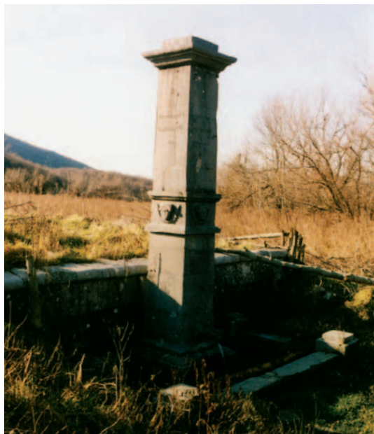
Obelisk iz 1846. godine na izvoru pokraj Ljubice

žlijebom (žlibom). Prostorije u vodenicama bile su rijetko veće od 4x5 metara. Dvije jače osnovne središnje grede nosile su kamena mlinska kola koja su se okretala preko drvene osovine kvadratnog profila. Žlice na osovini, također drvene, bile su posebne izrade, prilagođene kutu pod kojim je voda dolazila na njih. Kod gradnje mlina osobito je bila važna, a i zahtjevnija, izrada kamenih lukova ispod kojih je protjecala potrebna količina vode, tako da se vodenica doimala kao kuća na mostu. Vjerojatno zbog blagog nagiba i sporog toka potoka ovaj tip vodenice nije imao pogon preko bočnog vodenog kola.