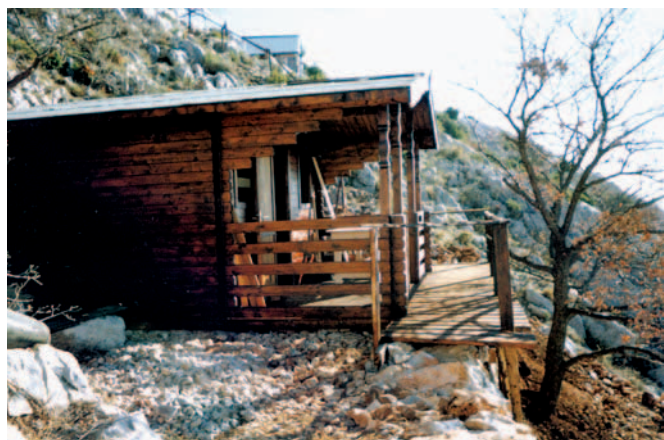
Planinarsko sklonište »Zlatko Prgin na Trtru (462 m)