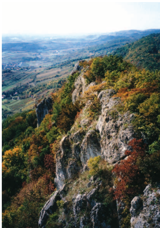
Greben Malog Kalnika okićen jesenskim bojama

na sigurno mjesto. Zalaganjem velečasnog Zvonka Martineza kip je nedavno obnovljen i smješten ispred župnog dvora u Gornjoj Rijeci. Narod kalničkog kraja još će dugo pamtit i svetu Barbaru i njezinu napuštenu, a potom srušenu kapelu. Za područje Malog Kalnika do sada se već čvrsto ukorijenio domaći naziv Pusta Barbara. Ljudi ovo ime ponekad pogrešno povezuju s Barbarom Celjskom, problematičnom ženom kralja Sigismunda, koja je neko vrijeme boravila u malokalničkoj utvrdi i ostala zapamćena kao Crna kraljica.