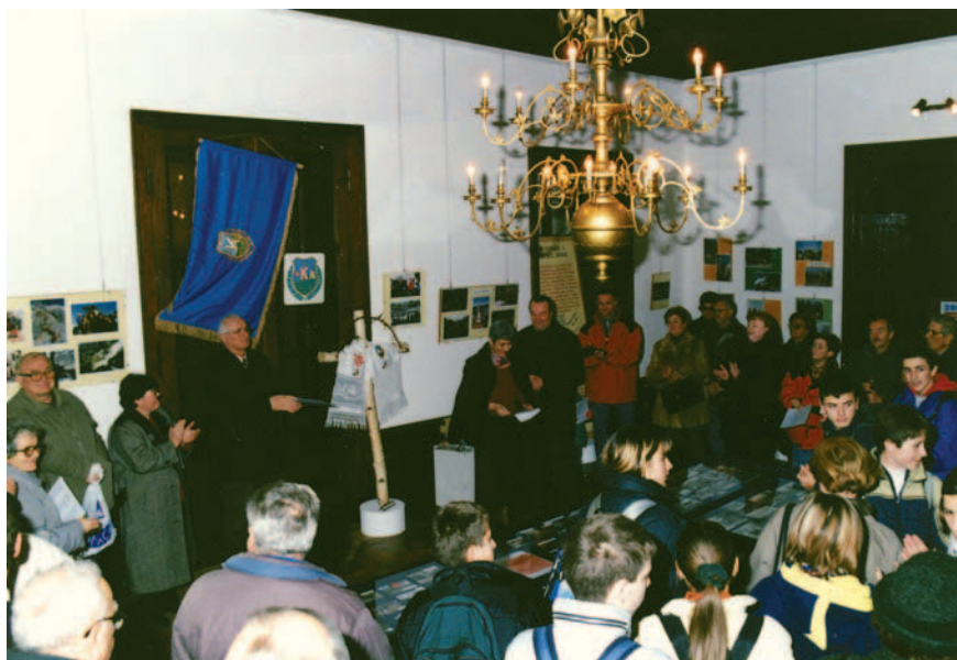
Otvoreње planinarske izložbe u Zavičajnom muzeju u Našicama

u humak koji nastaje od zemlje iz svih krajeva Hrvatske, kao simbol nacionalnog jedinstva. Značajno je primijetiti da su članovi »Hrvatskog sokola« ujedno i članovi planinarskog društva, pa ova gesta zacijelo predstavlja usklađenu akciju društava, koja potvrđuje značenje Krndije i Bedemgrada za našičko planinarstvo. U ime Našičana, nakon polaganja zemlje u Maksimiru, Jurković izriče sljedeće riječi: