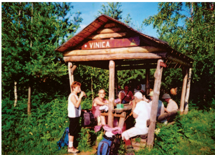
Nadstrešnica na Vinici

Vraćamo se u mjesto, do vatrogasnog doma, u kojem je kafić. Malo poslije idemo naprijed sporednom cestom, no nakon nekoliko minuta zaustavlja nas voda. Preplavila je cestu do visine gležnjeva. Neki su hrabro pretrčali po vodi, a drugi se vratili mimo vatrogasnog doma na glavnu cestu.