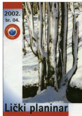
»Brodski planinar«, »Glasnik Kamenara« i »Lički planinar«