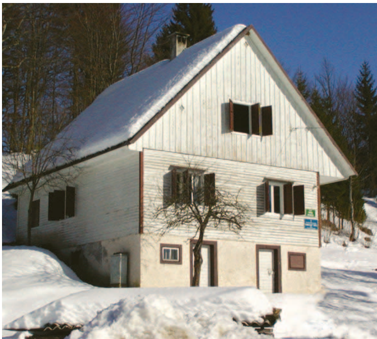
Planinarska kuća »Frbežari«

Još uvijek razmjerno malen broj ljudi posjećuje ovo područje u odnosu na ono što pruža. »Kamenjakovci« su odlučili pokušati jedinu planinarsku kuću u tom kraju dotjerati za ove i buduće naraštaje. Prošle smo godine od Komisije za gospodarstvo HPS-a putem natječaja dobili financijsku potporu za nabavku lima za pokrivanje kuće kojega namjeravamo ove godine i postaviti. Upravo radimo na svim predradnjama za preuređenje ove kuće sa željom da ona postane pla-