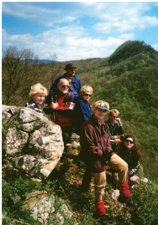
Na Križnom kamenu

U ovaj kraj najbolje je doći početkom proljeća ili u jesen kad nam pogled i putove ne zaklanja