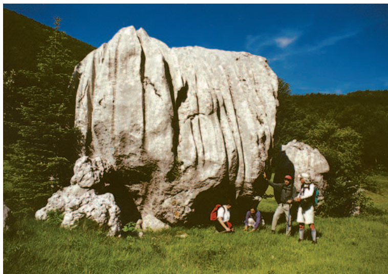
U Prpić dolubi

Zatim, ove godine na prvoj kosi iz smjera Oštarija (Stupačinova) prema Dabarskoj kosi nove oznake za Vranji kuk? Opet obmana! Stara pastirska staza za Mali Papratnjak kroz Klanac sada je omaljana. Jasno da je nagrđen ugođaj u Papratnjaku, toj krasnoj cvjetani. U smjeru