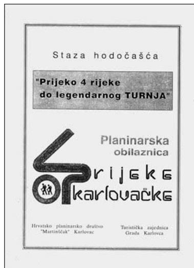
Dnevnik i vodič »4 rijeke karlovačke«

Prolazimo kroz Logorište - još jedno ime znano iz ratnih dana. Ruševine nekadašnje kasarne već urastaju u zelenilo. Na raskrižju ispred Turnja pogled mi privlači zanimljivo riječno čvorište. Malo ulijevo je most preko Mrežnice, a