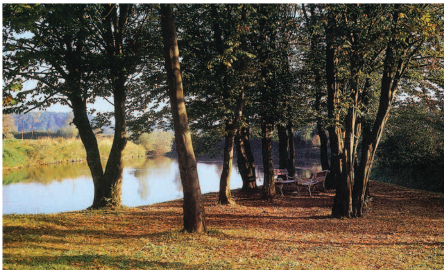
Kupa kod Karlovca

Polazište je mjesto Donje Pokupje na lijevoj obali Kupe (tu prolazi i pruga Karlovac - Ozalj - Kamanje, ali nema stanice - malo je dalje, u Mahičnom) ili mjesto Brodarci na desnoj obali. Tu je i most preko Kupe. Postoje lokalne autobusne