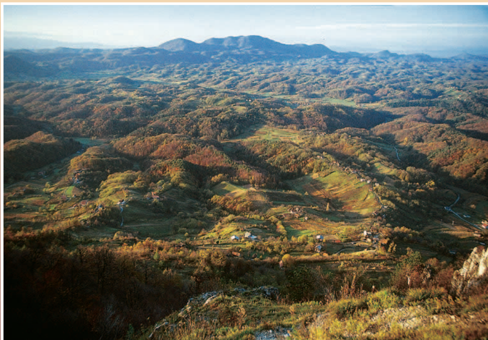
Pogled s Ravne gore prema Strahinjšči, foto: Antun Kasapović