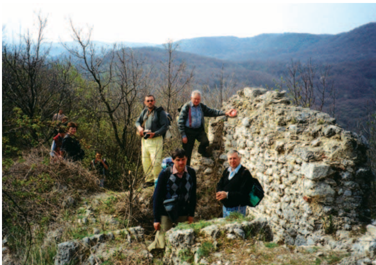
Ruševine utvrde na Malom Kalniku

Na upit o postanku neobičnog imena ovoga malog izvora mještani obližnjih potkalničkih