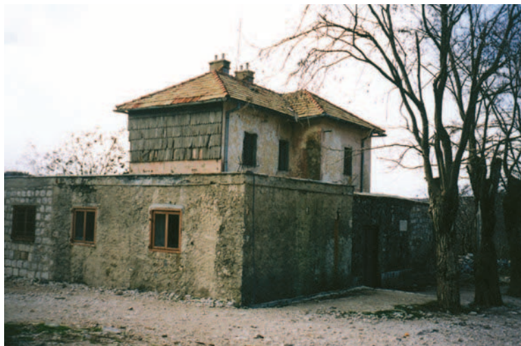
Dom na Vrbanju danas