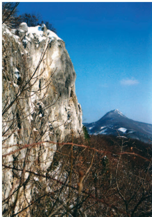
Pogled s Malog Kalnika na vrh Vranilac