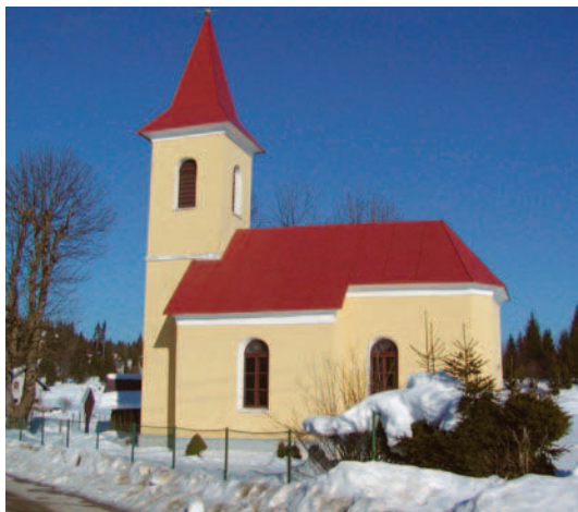
Crkva u Tršću