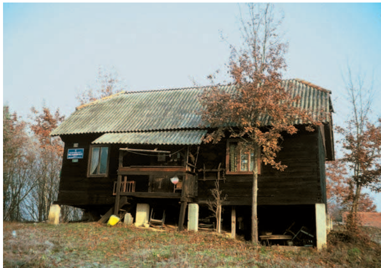
Planinarska kuća »Mont Zadobarje«

Dokora stižemo u Gornje Stative, uz most preko Dobre. Stative znam s nekih drugih skitanja (npr. s obilaska Dubovačkog puta - dionica Završje - Kalvarija). Sada idemo još malo uz Dobru, a onda je ostavljamo i penjemo se lijevo.