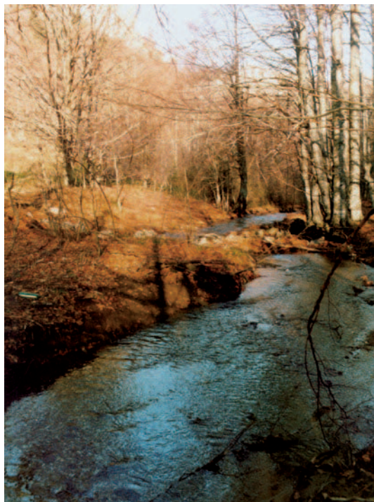
Tu je bio Bagajinski mlin (Crni potok)