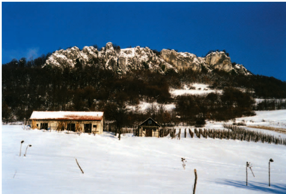
Mali Kalnik u snijegu

Vlasnici gospoštije kapelu su srušili krajem 18. stoljeća, a kip svete Barbare prenijeli u Gornju Rijeku i postavili uz cestu ispred dvorca. Tu je stajao sve do kraja Drugog svjetskog rata kada je nasilno uklonjen i pritom znatno oštećen. Njegovi ostaci krišom su prikupljeni, te pohranjeni